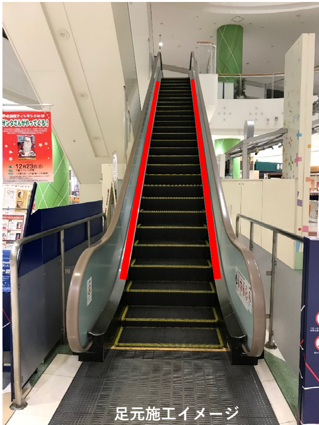
足元施工イメージ