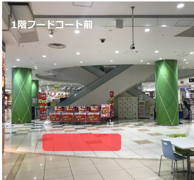
1階フードコート前