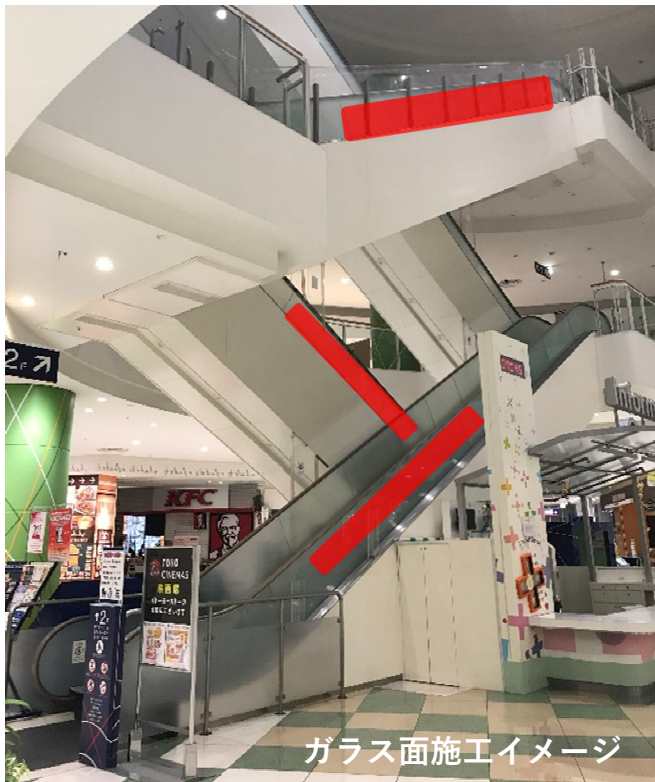
ガラス面施工イメージ